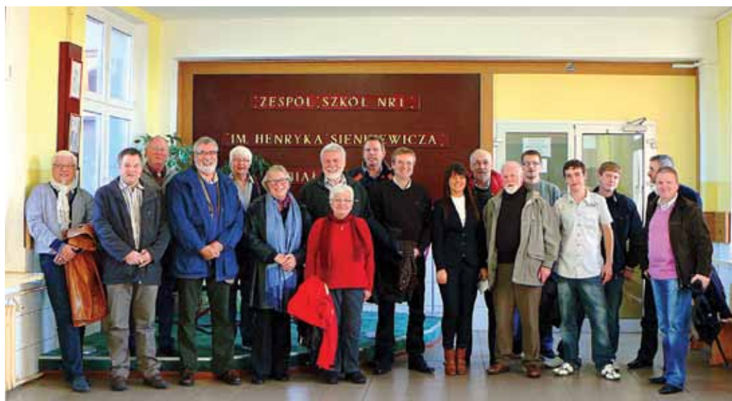
Delegacja z gmin partnerskich

Po przybyciu uczestników seminarium do domu rekolekcyjnego wszystkich spotkała