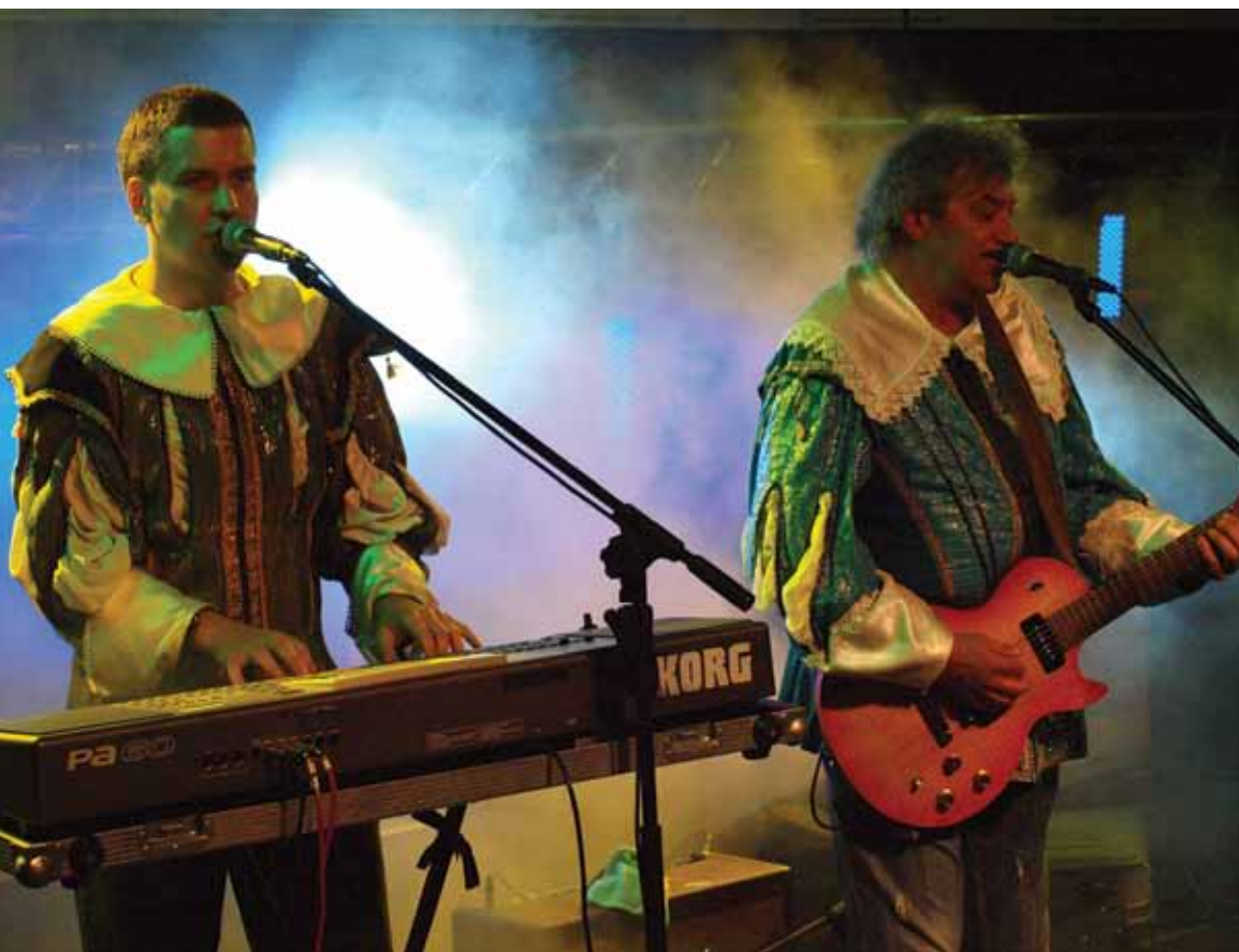
Gwiazda piątkowego wieczoru – zespół „Trubadurzy”