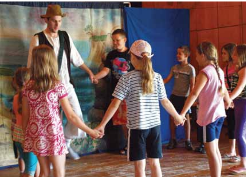
Wspólny występ grupy teatralnej „Art-Re” z Krakowa wraz z młodymi widzami.