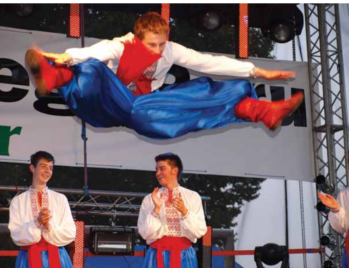
Blok mniejszości ukraińskiej – zespół taneczny „Witrohon”