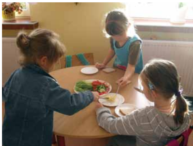
Odżywiamy się zdrowo i kolorowo